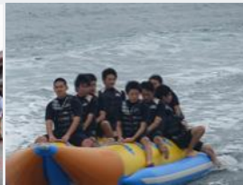
マリンスポーツ体験