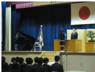
卒業生代表の答辞