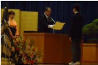
各クラスの代表生徒へ