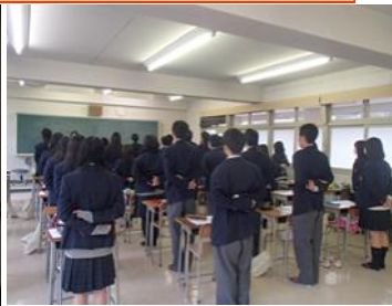
進路別ガイダンス