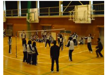
1年生、2年生とも種目はミニソフトバレーボール