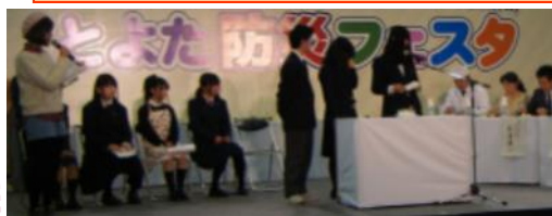
高校生防災スイーツコンテストで優秀賞受賞