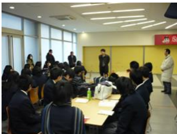
学年主任・進路指導主事より激励。 38名がチャレンジしました。