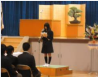
送辞を述べる生徒会長