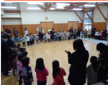
1年C組の「音楽」選択生徒による発表 「人間ていいな♪」