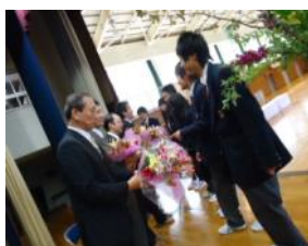
離任式の転退任者に花束