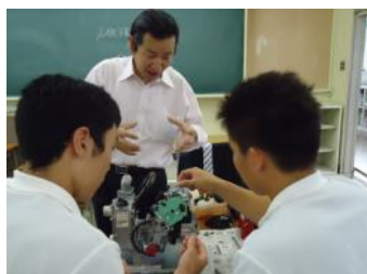
名鉄自動車専門学校