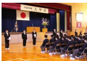
1年担任発表、職員紹介