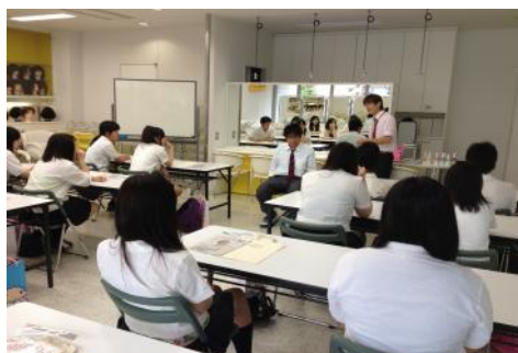
中部美容専門学校

セントラル・トリミング・アカデミーで体験授業をしました。聞くとやってみるでは大違い?