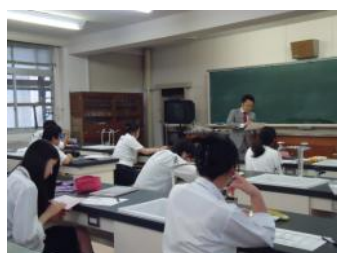
大原法律公務員専門学校